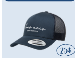
Casquette adulte (unisex)