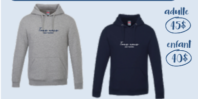
Kangourou adulte et enfant (unisex)