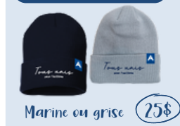
Tuque adulte (unisex)